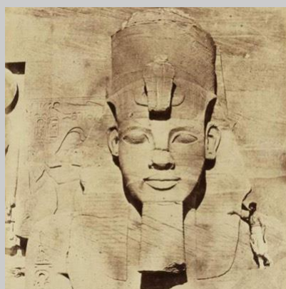
GEO - septembre 2018 Les premiers explorateurs photographes Lire la suite