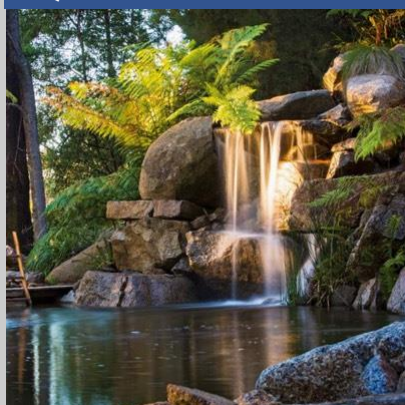
GEO - octobre Japon, Australie, Angleterre... Les plus beaux jardins du monde Lire la suite